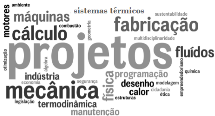
Figura 3 – Nuvem de palavras segundo a matriz curricular.

Por fim, apresentam-se na Figura 3 os termos mais comuns, segundo os conteúdos didáticos da matriz curricular, previstos no perfil de formação do egresso em engenharia mecânica 5 .