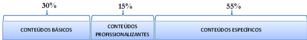
Figura 1- Distribuição de conteúdos.

Em conformidade com as DCN's para os cursos de engenharia (BRASIL, 2002), a matriz curricular do curso de engenharia mecânica tende a uma distribuição aproximada de conteúdos conforme apresentado na Figura 1.