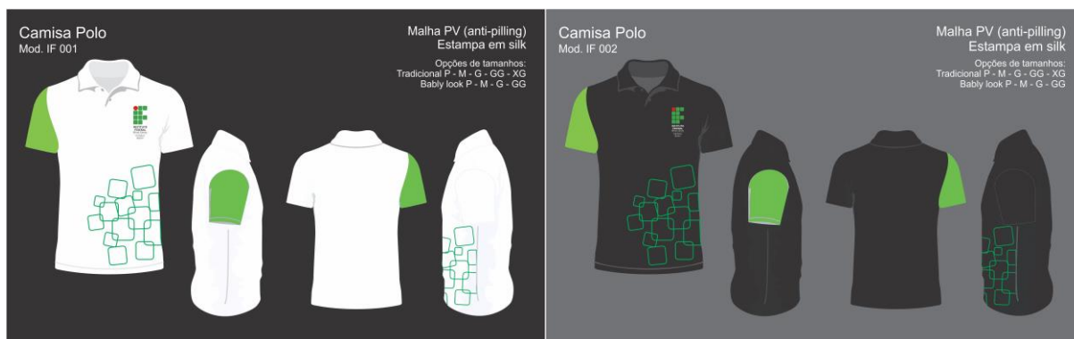
Figura 1 – Camisa Gola Polo em duas versões