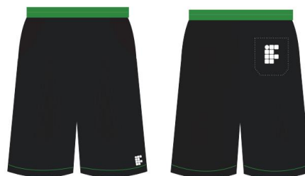
Figura 4 – Modelo de Calça e de Bermuda