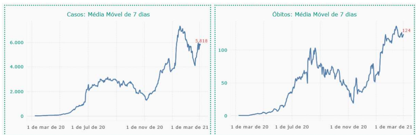
Figura 2: Média móvel de 7 dias para novos casos e óbitos por Covid em Minas Gerais.

De maneira semelhante ao cenário nacional, no último mês a média móvel de 7 dias superou todos os meses de 2020, e vem apresentando tendência de alta tanto para novos casos quanto para óbitos, segundo dados do CONASS. Nos gráficos da figura 2 estão representadas as médias móveis de 7 dias para novos casos e óbitos em Minas Gerais, desde a primeira semana epidemiológica de notificação da doença.