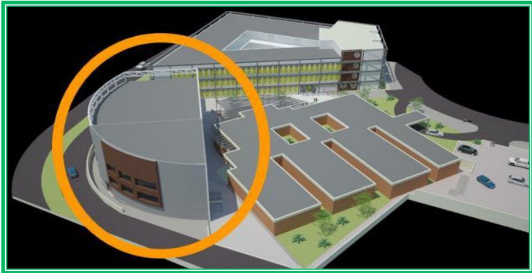
Figura 6 – Expansão, vista Bloco II.