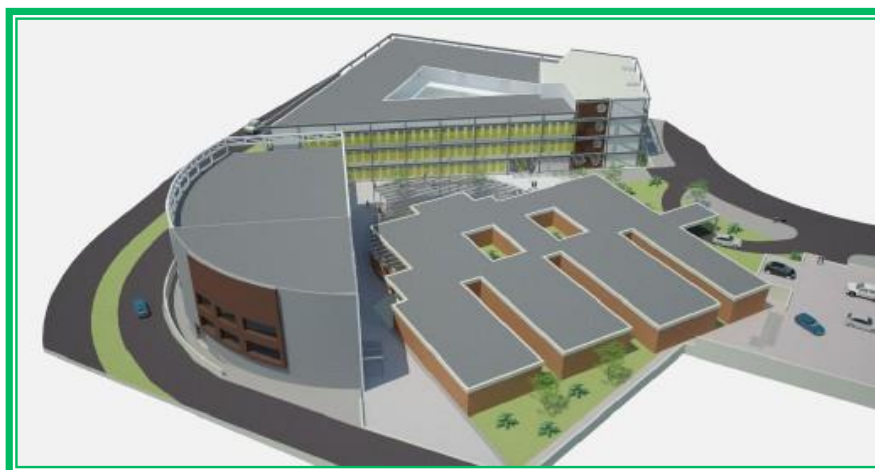
Figura 4 - Projeto arquitetônico de expansão do Campus. FONTE: BOAS (2010)

Este Campus abrigará confortavelmente salas de aulas, auditórios, gabinetes dos docentes, laboratórios de metalurgia, pesquisa e/ou prestação de serviços, biblioteca, laboratórios de ensino de informática, serviço de fotocópias, diretoria, secretarias de setores, banheiros masculino e feminino, cantina com restaurante, etc. Assim, o IFMG disporá de instalações físicas amplas e apropriadas às atividades de ensino. A Figura 4 apresenta o projeto de expansão do Campus Ouro Branco elaborado pela arquiteta Paola Vilas Boas em 2010.