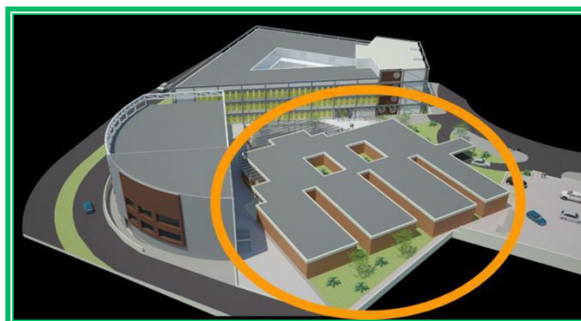
Figura 5 – Expansão, vista Bloco I.

Além deste espaço construído, há um total de 8.853,14m 2 de área livre, destinada ao Projeto de Expansão, que será composto por 3 blocos de construção. O Bloco I, Figura 5, com área construída de 1.677,75m 2 será composto de: (a) uma biblioteca, (b) administração e, (c) uma área de convívio.