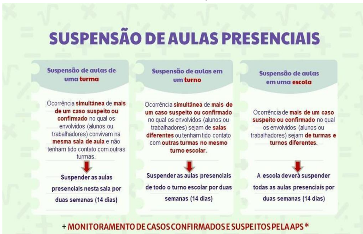
Figura 1 – SITUAÇÕES EM QUE O GESTOR ESCOLAR DEVERÁ SUSPENDER AS AULAS DE UMA TURMA, TURNO OU DE UMA ESCOLA