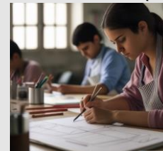
habilidades ( skills )