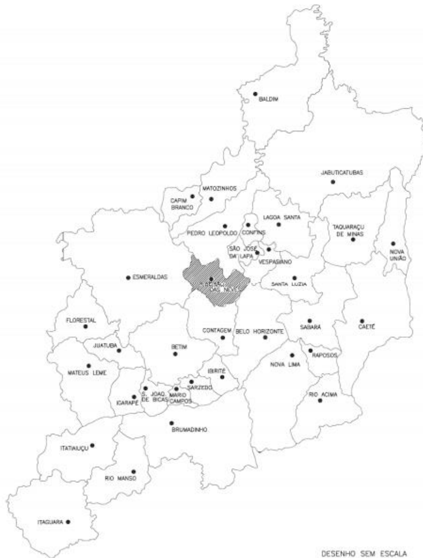
Figura 1: Ribeirão das Neves na Região Metropolitana de Belo Horizonte

R. Vera Lúcia de Oliveira Andrade, 800 - Vila Esplanada, Ribeirão das Neves - MG, 33805-488 (31) 3627-2303 - https://www.ifmg.edu.br/ribeiraodasneves