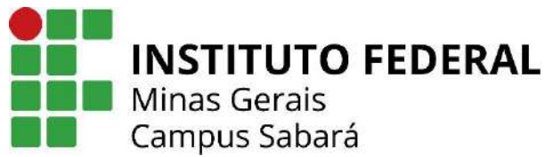
Figura 1: Logo do IFMG campus Sabará