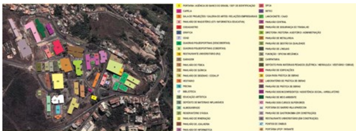
Figura 3 – Exemplo do mapa temático do campus Ouro Preto, feito pelo Corel Draw.

Criou-se como parte inicial da navegação da realidade virtual, um mapa temático do IFMG campus Ouro Preto, com legenda utilizando cores, números e nomes, de modo a auxiliar o usuário na escolha dos pontos e até mesmo a identificação dos referidos locais (Figura 3). Para criação deste mapa utilizamos o software Corel Draw e Google Maps.