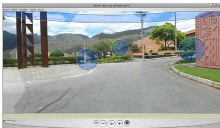
Figura 2 – Exemplo dos links de conexão (hot post) entre uma panorama e outra.

O conjunto de nós e toda a rede de panoramas, permitem ao usuário navegar internamente pelo campus do IFMG, tendo links para levá-lo de um panorama ao outro, proporcionando ao usuário buscar a cena referente ao local de seu interesse (Figura 2).