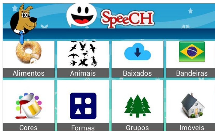
Figura 2 – Categorias da segunda página.