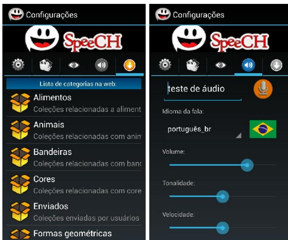
Figura 4 – Categorias disponíveis e configurações individuais.

Além de criar as próprias categorias, inserindo imagens comuns ao dia-a-dia da criança (familiares, animais de estimação, móveis de sua casa etc.), via configurações do aplicativo, o responsável pelo usuário pode ainda instalar diversos pacotes de imagens pré-elaborados (Figura 4a), assim como configurar as características de leitura de voz conforme a necessidade de cada criança (Figura 4b).