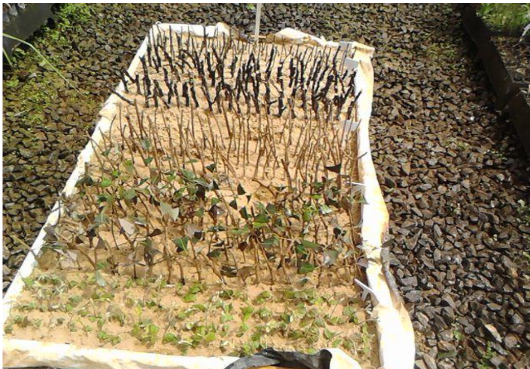
Figure 3 - Demonstração do leito pronto com as estacas.