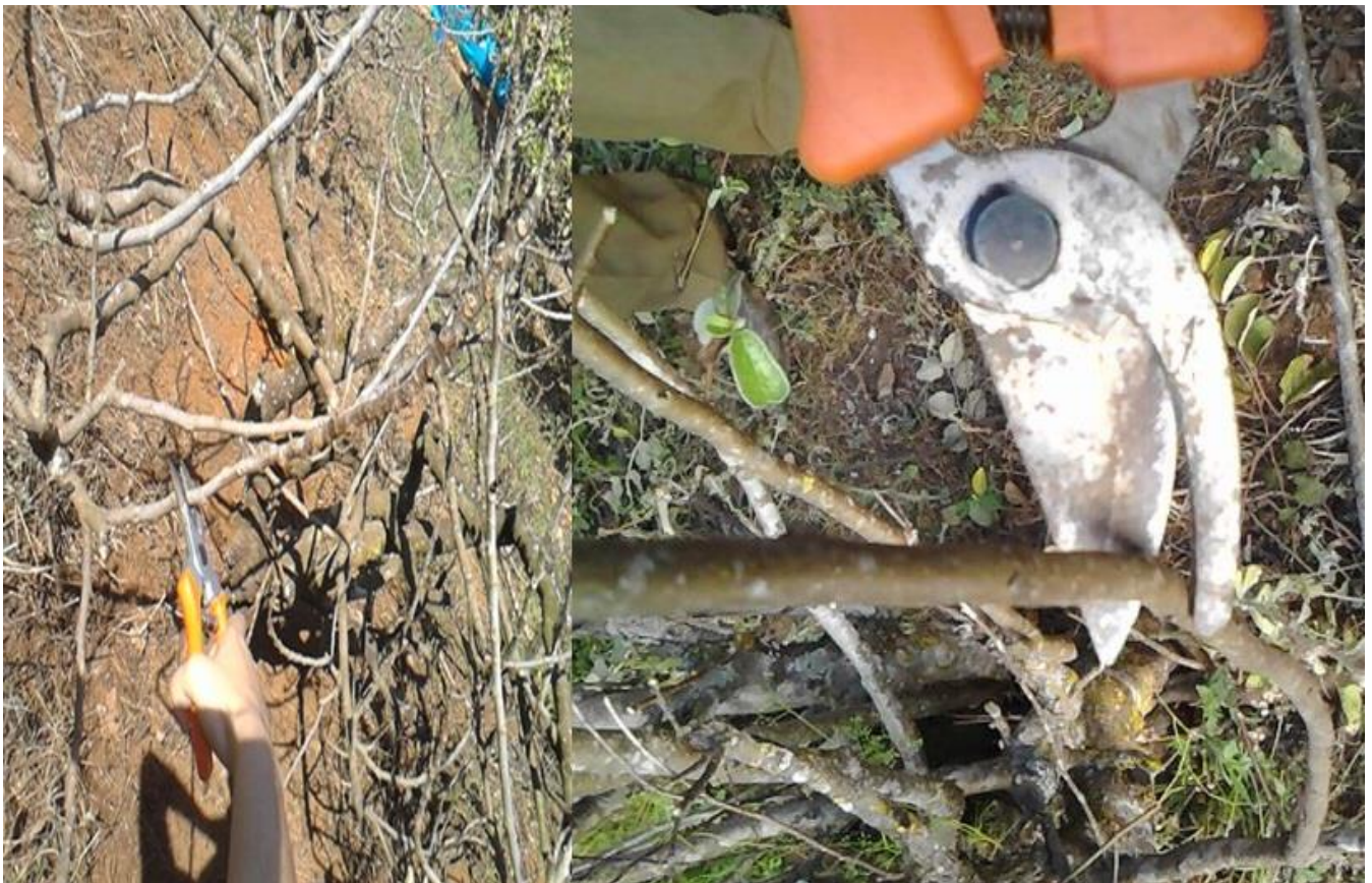
Figura1- Demonstração do processo de coleta das estacas de figo e marmelo.

Aos 30 e 60 dias, foi avaliado: o número de brotações por estaca; e aos 90 e 120 dias, o número de estacas enraizadas.