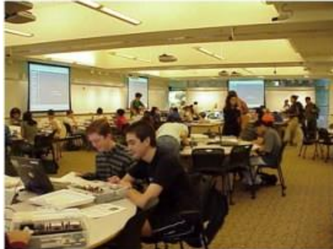
Figura 2 - MIT Massachusetts Institute of Technology - TEAL