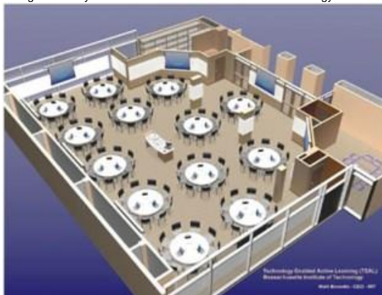
Figura 3 - Layout MIT Massachusetts Institute of Technology - TEAL