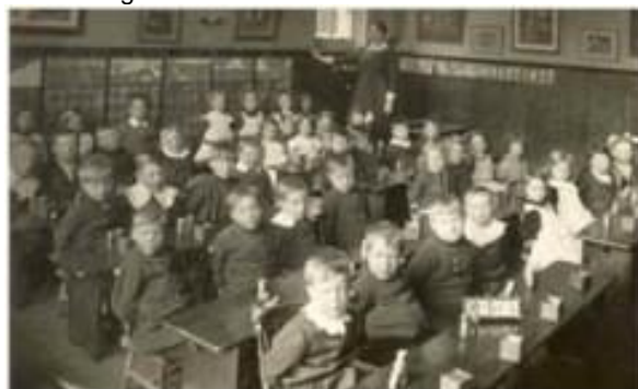
Figura 1 - Sala de aula na era industrial