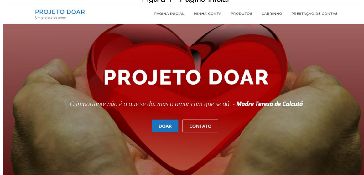
Figura 1 - Página inicial

O website foi produzido para ser exposto de forma mais clara, tornando a experiência do usuário mais agradável e fácil. Quando aberto o website, mostra-se a tela inicial com o nome do projeto, na parte superior da página contém o menu com as seguintes opções: Pagina Inicial, Minha Conta, Produtos, Carrinho e Prestação de Contas (FIGURA 1).