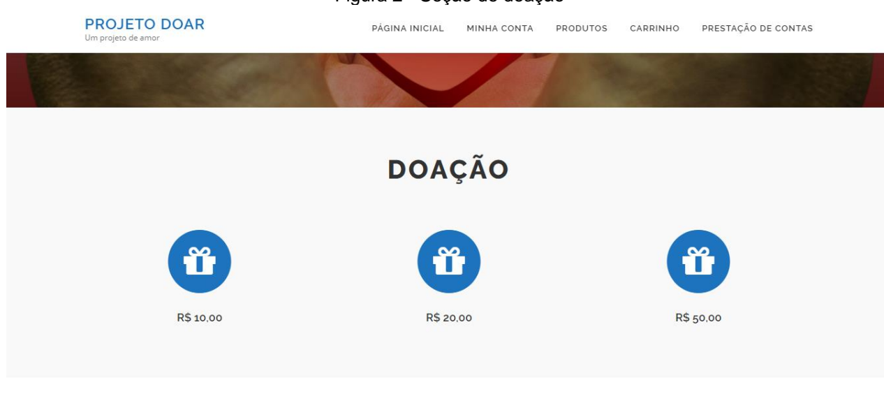
Figura 2 - Seção de doação

Na parte mais central contém dois botões: Doar e Contato. Ao se clicar no botão Doar a página desce para a seção Doação onde estará disponível os botões com os respectivos valores: 10, 20 e 50 reais, conforme Figura 2. Uma seção mais abaixo estará disponível um texto constando as informações dos responsáveis pelo projeto e um breve resumo sobre o que é projeto doar. A seguir vem a seção dos apoiadores com as informações das empresas que estarão contribuindo para o sucesso do projeto. E no final da página consta campos na qual o usuário preencherá se precisar entra em contato com os responsáveis pelo site.