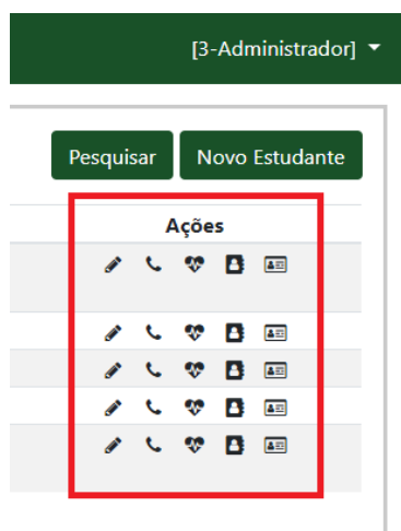
Figura 4: Botões de ação da página de estudantes

Todas as listagens do sistema apresentam botões de ação relacionados com cada registro apresentado. Na Figura 4 estão destacados os botões de ação para os estudantes armazenados na base de dados. O primeiro botão de ação serve para alterar os dados básicos de cadastro, o segundo para manutenção nos dados de contato, o terceiro para detalhar informações médicas, o quarto para gerenciar a foto e o último para gerar a ficha do estudante contendo todas as informações do mesmo que estão registradas nas diversas seções do sistema. Por padrão, todas as páginas também possuem o botão para inclusão de registros (“Novo”) e o botão de pesquisa para que o usuário possa filtrar os registros exibidos.