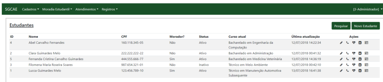
Figura 2: Página de manutenção de Estudantes

A primeira versão do sistema já possibilita aos usuários da CAE a gestão dos dados básicos dos estudantes, internos da Moradia Estudantil, registro de atestados, ocorrências e atendimentos na enfermaria. A equipe do projeto optou por elaborar um projeto visual simplificado e padronizado, considerando o público-alvo do sistema. Todas as páginas apresentam o mesmo formato gráfico, tanto em aspectos de tipografia e cores como em relação aos elementos utilizados nos formulários. A Figura 2 apresenta a página inicial para manutenção dos estudantes. Ressalta-se que os dados apresentados são fictícios e serviram apenas para validação durante os testes conduzidos antes da liberação da versão.